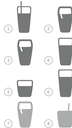
Routine et observance

L'eau est le choix idéal. Les boissons contenant de la caféine (cola, café, thé et certaines boissons énergisantes) et des édulcorants artificiels sont des irritants connus de la vessie et peuvent devoir être limités au minimum.