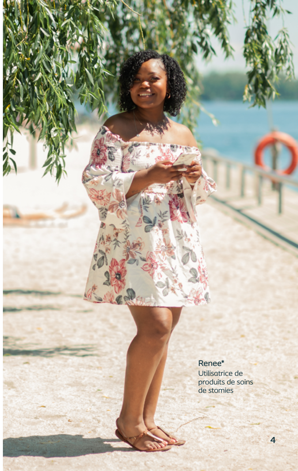
Renee* Utilisatrice de produits de soins de stomies

Assurez-vous de vérifier si votre fournisseur de carte de crédit ou votre régime d'assurance maladie prévoit une assurance voyage, pour une meilleure tranquillité d'esprit.