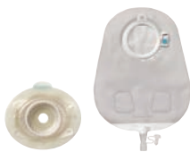
Protecteur cutané et sac séparés