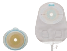
Protecteur cutané et sac séparés